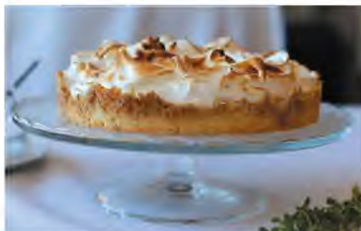
Торт с лимонным курдом

В связи с открытием летней площадки в команду «Пропорции» требуются официанты, официанты-бармены, пекарь-кондитер, администратор зала и организатор банкетов. По всем вопросам обращаться по телефону: +7-8482-950-566. Информацию о вакансиях можно найти в аккаунтах и группах кафе «Пропорция» в социальных сетях.