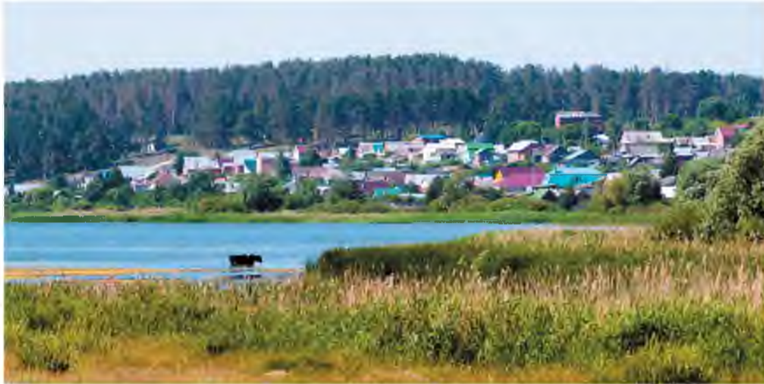
«На свалку лебеди не прилетят», – говорят жители Васильевки, уверенные в том, что мусорный полигон – неподходящий сосед для их села

Свалки в Васильевке не будет: областное правительство поставило точку в планах группы компаний «Эковоз» построить рядом с селом мусорный полигон.