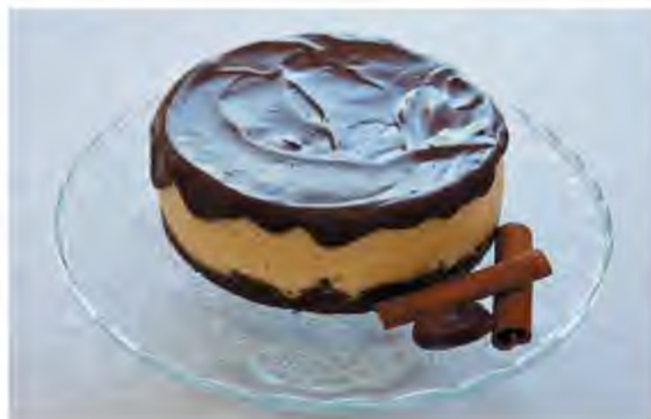
Торт «Птичье молоко» из аквафабы