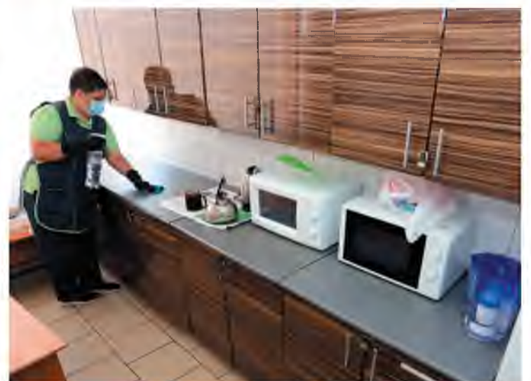
Дезинфекцию помещений проводят каждые два часа