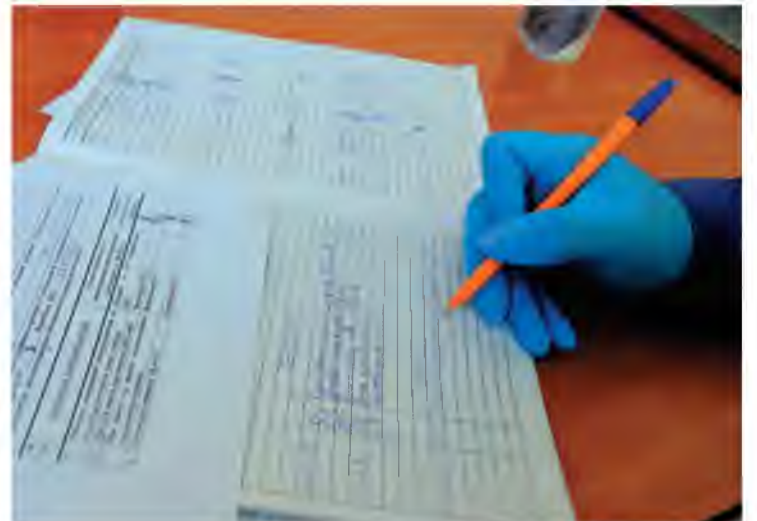
Наряды-допуски оформляют в отдельном помещении