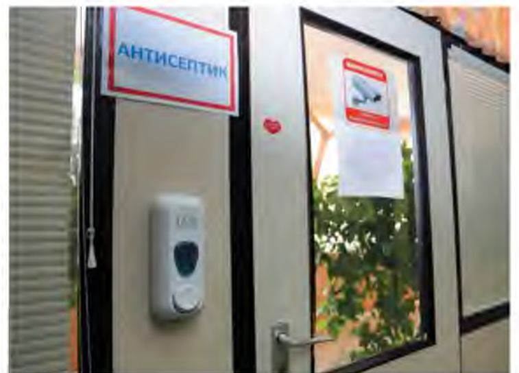
Во всех общественных пространствах на заводе доступны антисептики