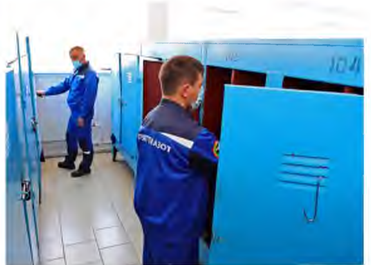
В раздевалках соблюдают дистанцию в 1,5 метра

Мероприятия «Постковид» действуют на Тольяттиазоте со 2 июля согласно приказу генерального директора. Напомним, 1 июля после двухмесячной изоляции санаторий «Надежда» покинули сотрудники производств и ремонтных служб.