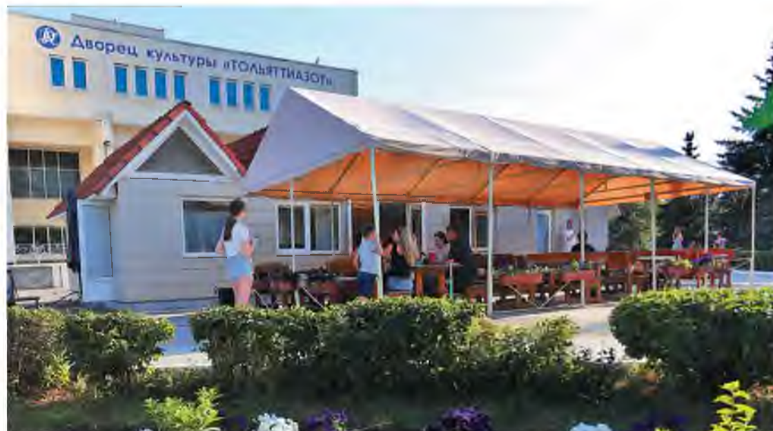
Летнее кафе «Пропорция» работает семь дней в неделю

«Волжский химик» УЧРЕДИТЕЛЬ ГАЗЕТЫ – ПАО «ТОАЗ»