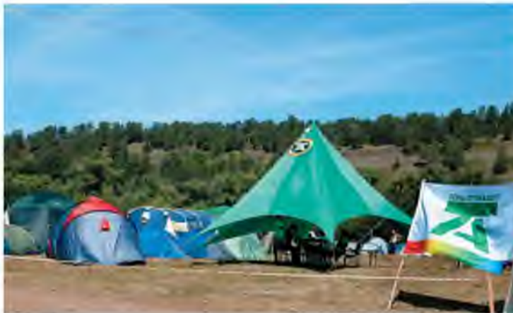
Снимок из архива: делегация Тольяттиазота на фестивальной поляне Грушинки

Туристическая романтика и бардовские песни всегда были