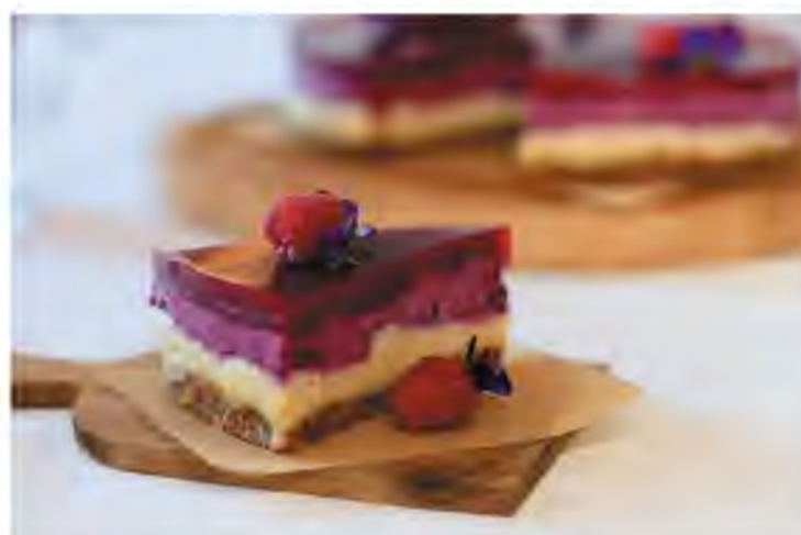
Кешью-кейк с чёрной смородиной и желе