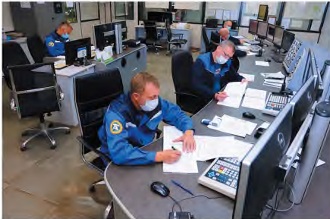
На ЦПУ все работают в масках и на расстоянии